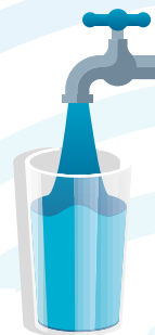
TABELA DE TARIFAS E PREÇOS 2023