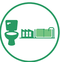
Saneamento de Águas Residuais Urbanas