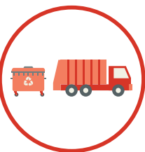
Gestão de Resíduos Urbanos