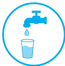
Abastecimento Público de Água